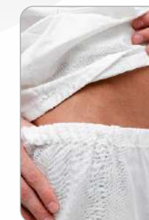
Кальсоны на резинке

ТР ТС 017/2011 ТО 12-11-2012 Ткань: бязь отбеленная хлопок - 100%, плотность - 125 г/м2 Цвет: белый Размер: 88/92 - 120/124 Рост: 158/164 - 182/188