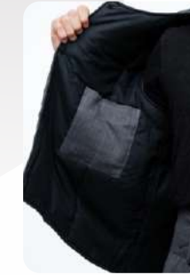
Потайной карман в жилете