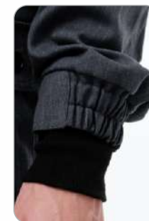
Манжеты на резинке

ТР ТС 019/2011 ТО 17-04-2017 Ткань: Горизонт ТА 40 с антистатической нитью хлопок - 75%, полиэстер - 25%, отделка КОМП, 395 г/м2 Утеплитель жилета: полиэфир 100%, плотность 150 г/м2. Световозвращающий материал: лента арт.9904Н (50 мм) Цвет: серо-оранжевый Размер: 88/92 - 120/124 Рост: 158/164 - 182/2188