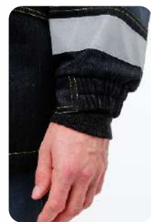
Манжеты на резинке

ТР ТС 019/2011 ТО 08-03-2018 Ткань: хлопкополиэфирная Забой с антистатической нитью хлопок - 60%, полиэстер - 40% плотность - 320 г/м2 Ткань для плечевых накладок: полиэстер - 100% водоотталкивающая отделка, мембранное покрытие плотность - 215 г/м2 Световозвращающий материал: лента арт.9904Н (50 мм) Цвет: серый/черный/красный - кокетки Размер: 88/92 - 128/132 Рост: 170/176 - 194/200