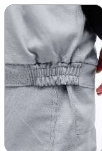
Куртка на резинке