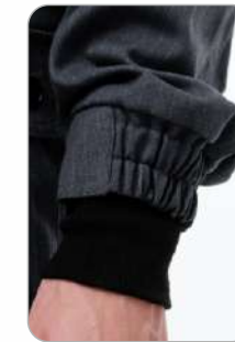
Манжеты на резинке