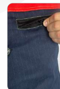
Нагрудный карман на замке

ТР ТС 019/2011 ТО 03-08-2021 Ткань верха: хлопкополиэфирная с антистатичной нитью Забой хлопок - 60% полиэстер - 40% плотность - 320 г/м2 Подкладка жилета: Бязь гладкокрашенная хлопок - 100%, плотность - 140 г/м2 Утеплитель жилета: Синтетический объемный каландрированный материал полиэстер - 100% плотность - 150 г/м2 Цвет: серый с оранжевым Размер: 88/92 - 128/132 Рост: 170/176 - 194/200