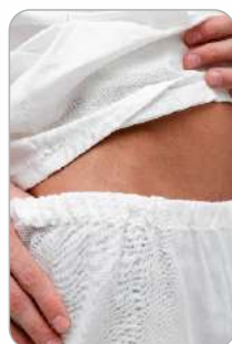
Кальсоны на резинке

ТР ТС 017/2011 ТО 12-11-2012 Ткань: бязь отбеленная хлопок - 100%, плотность - 142 г/м2 Цвет: белый Размер: 88/92 - 120/124 Рост: 158/164 - 182/188