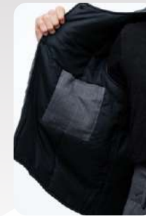
Потайной карман в жилете