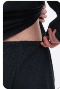
Кальсоны на резинке

ТР ТС 017/2011 ТО 12-11-2012 Ткань: фланель хлопок - 100%, плотность - 170 г/м2 Цвет: чёрный Размер: 88/92 - 120/124 Рост: 158/164 - 182/188