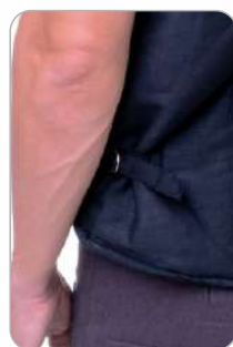
Регулировка по ширине

ТР ТС 019/2011 ТО 03-08-2021 Ткань верха и Подкладка: Бязь гладкокрашенная хлопок - 100%, плотность - 125 г/м2 Утеплитель жилета: Синтетический объемный каландрированный материал полиэстер - 100% плотность - 200 г/м2 Цвет: чёрный Размер: 88/92 - 128/132 Рост: 170/176 - 194/200