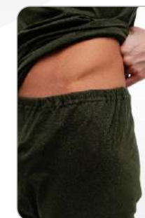
Кальсоны на резинке

ТР ТС 017/2011 ТО 28-04-2015 Ткань: полотно трикотажное хлопок - 100%, плотность - 180 г/м2 Цвет: оливковый Размер: 88/92 - 120/124 Рост: 158/164 - 182/188