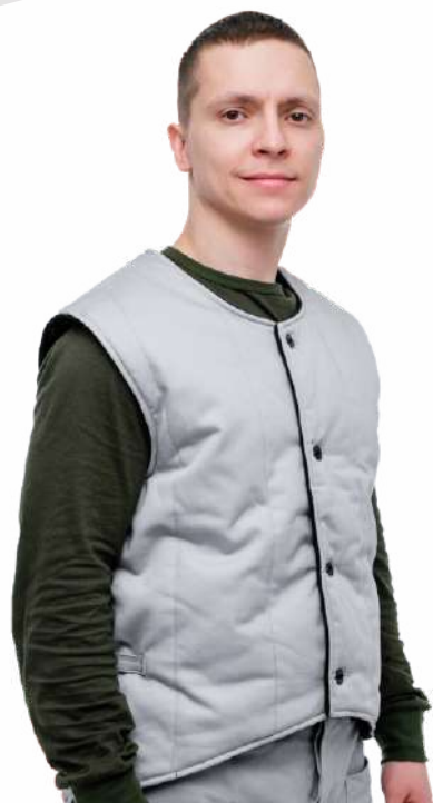
Жилет утеплённый «МАЙНЕР» в комплекте